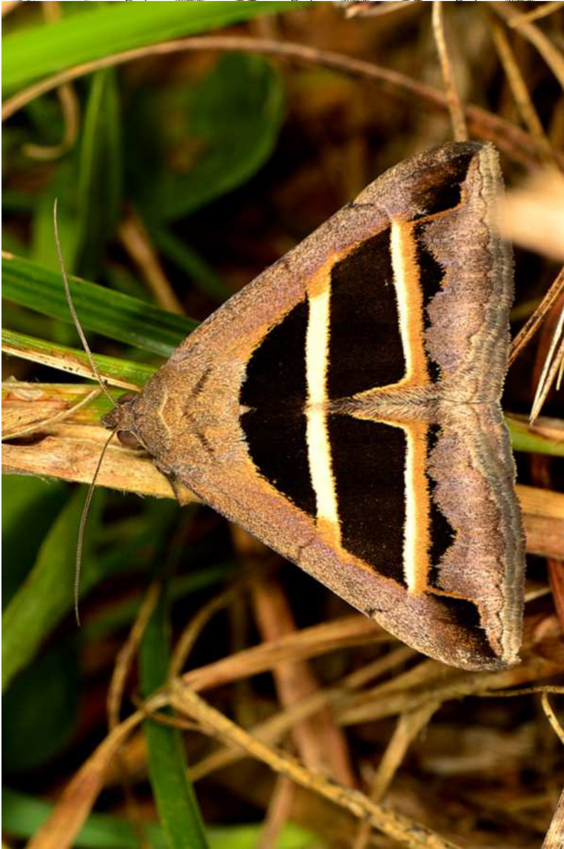
Grammodes bifasciata (Petagna, 1787)