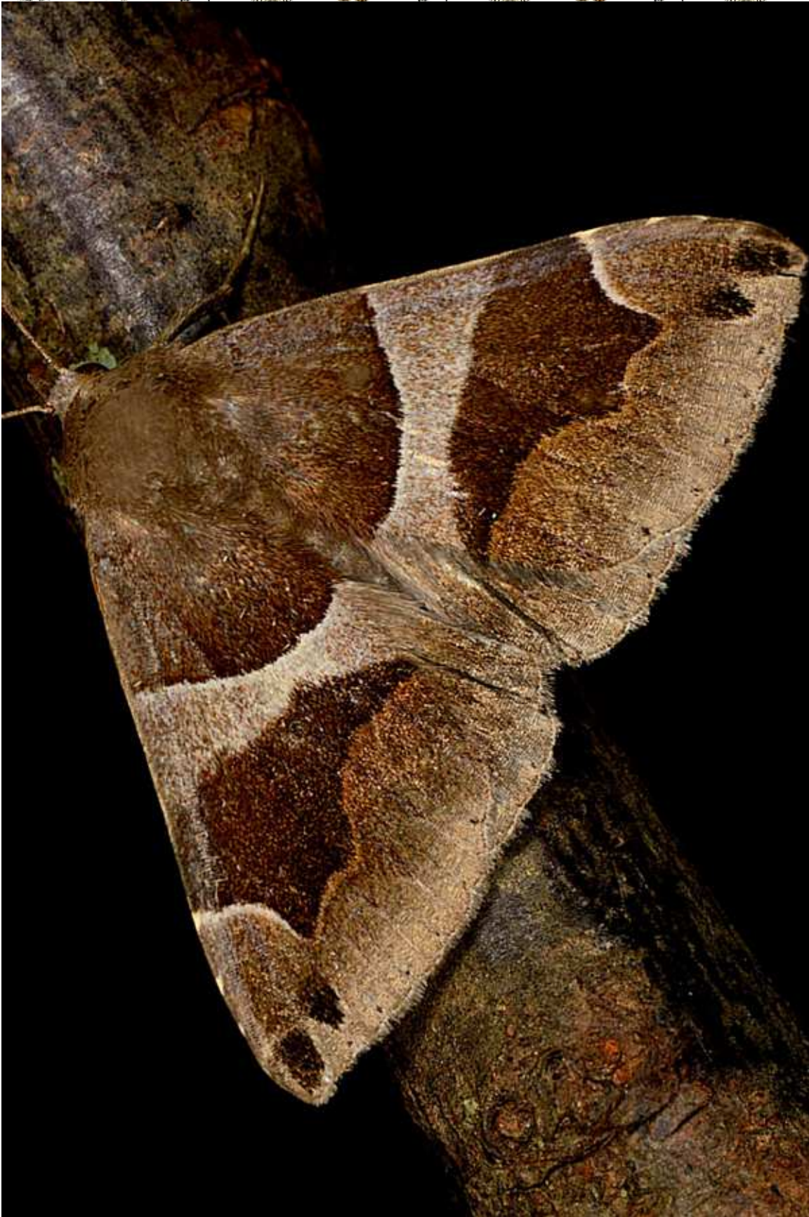
Dysgonia algira (L. 1767)