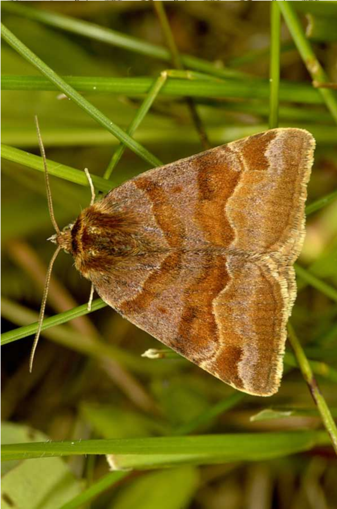
Euclidia (Euclidia) glyphica (L. 1758)