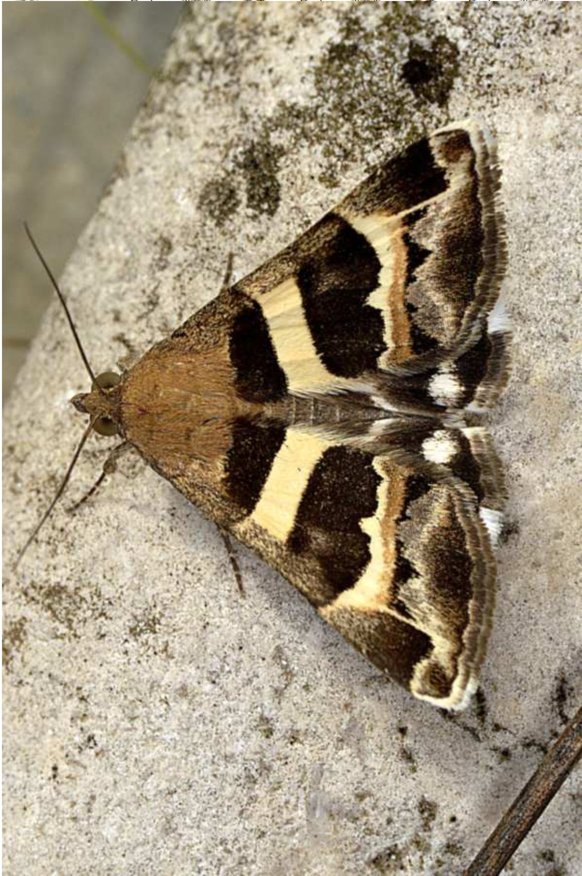
Grammodes stolidata (Fabricius, 1775)