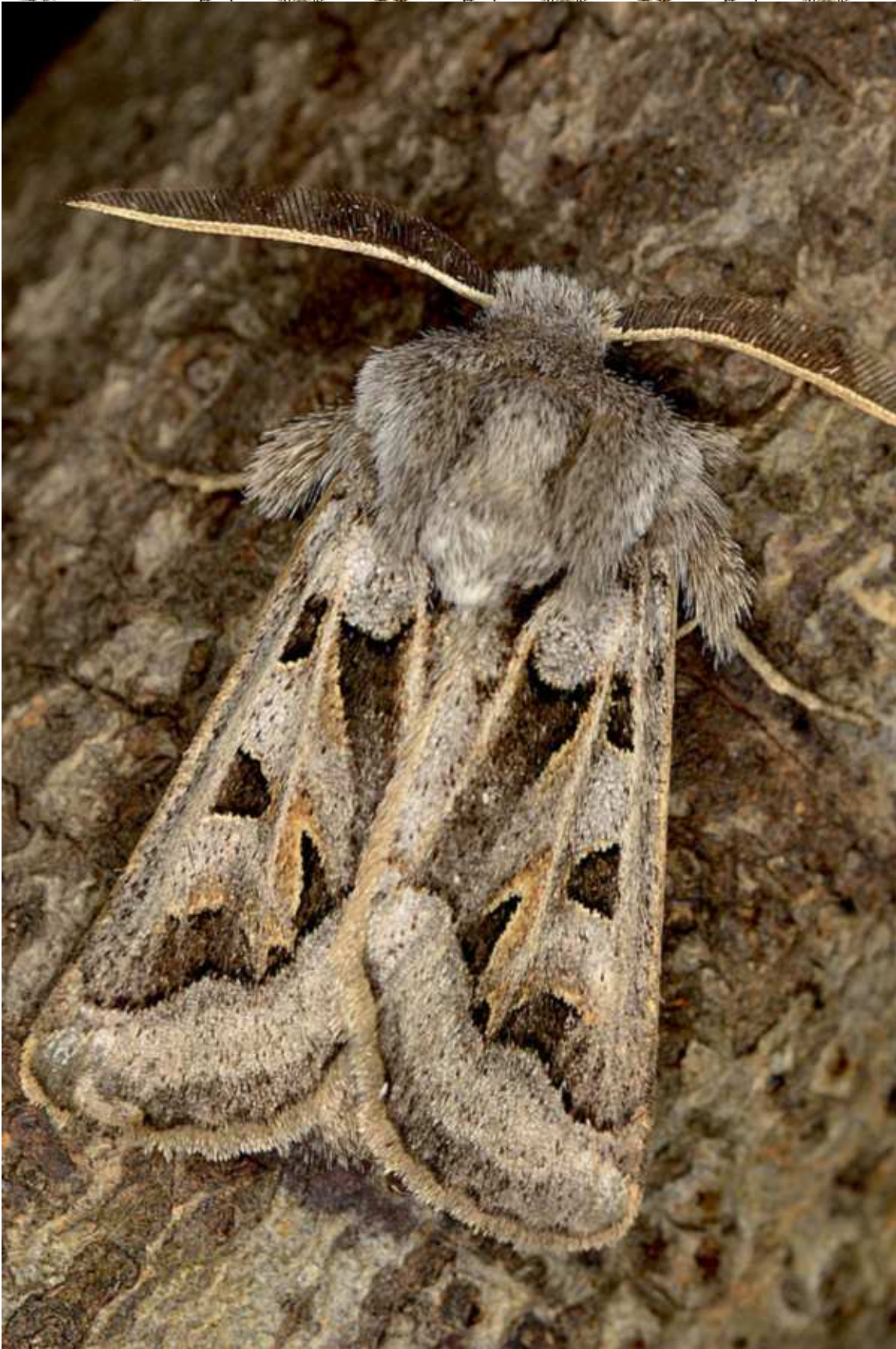
Episema glaucina (Esper, [1789])