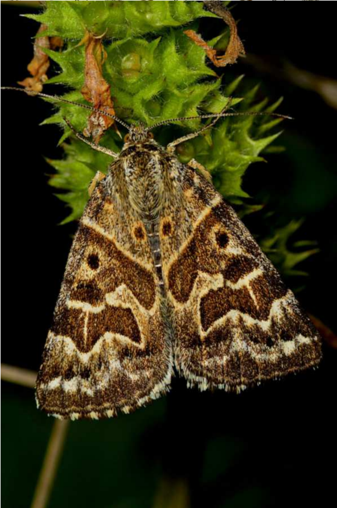
Euclidia (Callistege) mi (Clerck, 1759)