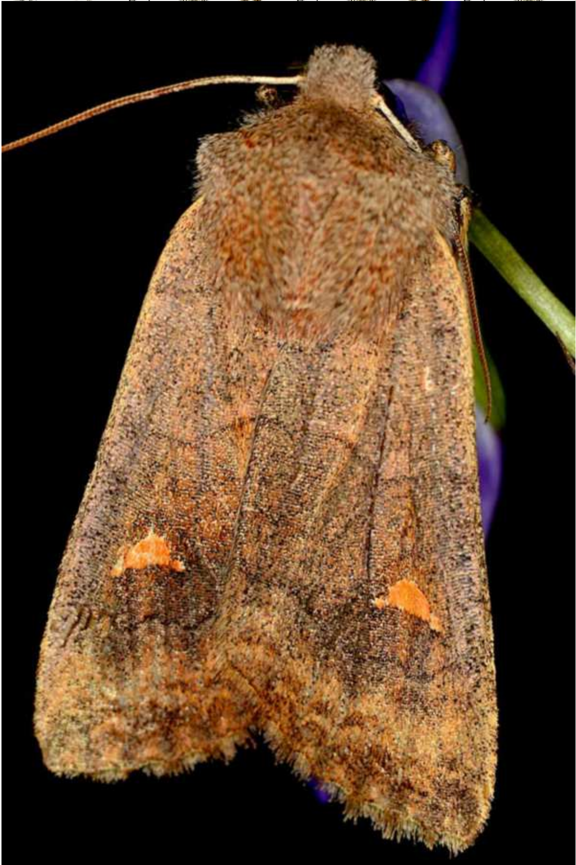
Eupsilia transversa (Hufnagel, 1766)