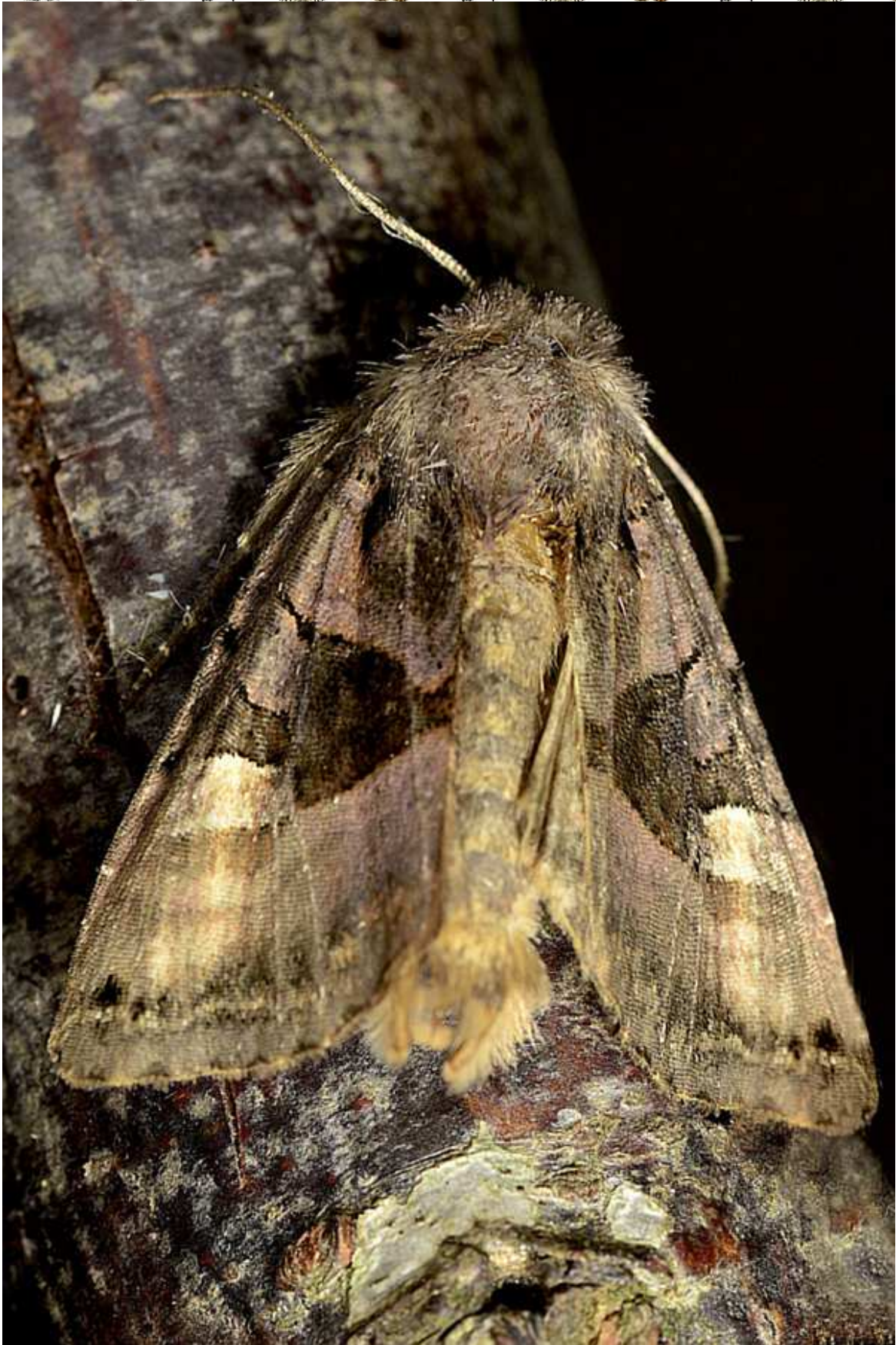
Euplexia lucipara (Linnaeus, 1758)