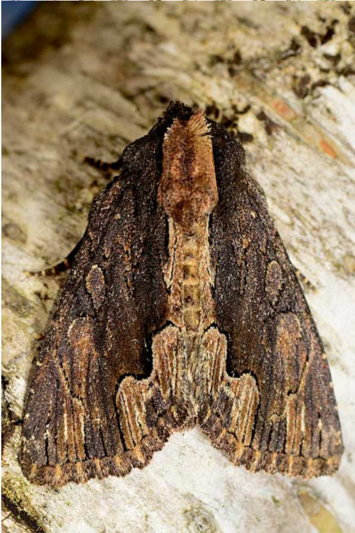
Dypterygia scabriuscula (Linnaeus, 1758)