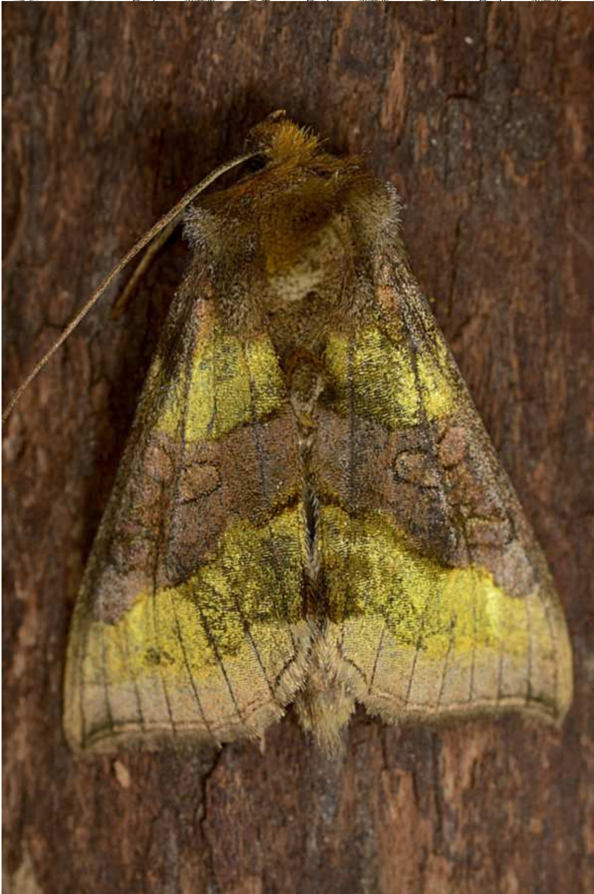
Diachrysis stenochrysis (Warren, 1913)